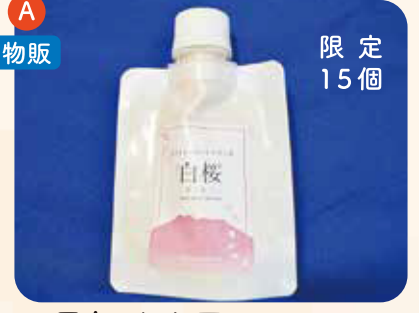
15周年 火山灰石けん(白桜) 限定 15個 ¥1,500

県産の火山灰シラスの超微粒子を使った洗顔石鹸です。(2005年2月から販売)是非お求めください!