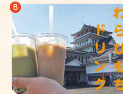
わらび餅ドリンク choice (ホット・アイス) ¥400

2020年11月7日(日)~11月14日(日)は、日頃の感謝を1000倍返しの8日間!!