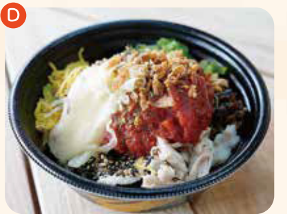
トマトチーズ鶏飯 ¥800