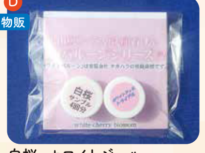
白桜・ホワイトジェルトラベルセット ¥200