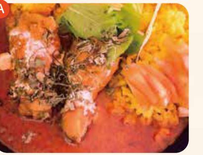
チキンコルマカレー ¥800

県産食材を使用した、ヨーグルトをベースにしたインドカレーと、ココナツの甘味とトマトの酸味がマッチした県産食材を使用したスパイスカレー。2種類のルッをあいがけでもお楽しみください!!