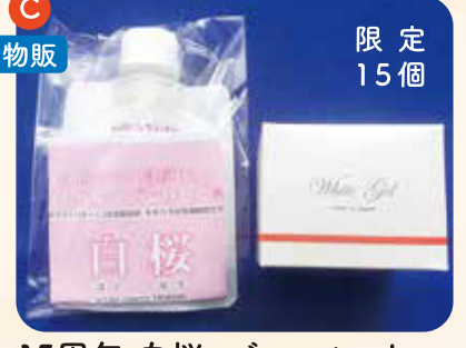
15周年 白桜・ジェルセット 限定 15個 ¥3,000