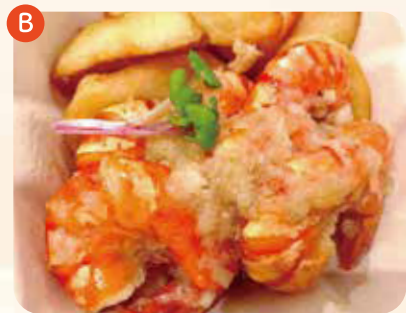
ガーリックシュリンプ 露島産マイクロリーフ添え ¥1,000