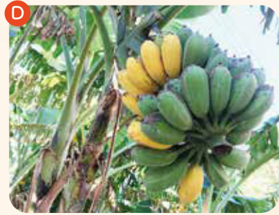
神造りバナナジュース ¥800