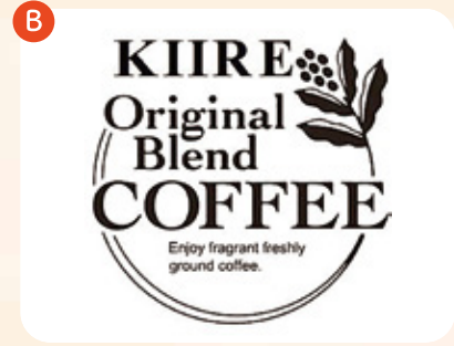
喜入珈琲 オリジナルブレンド choice (ホット・アイス) ¥300