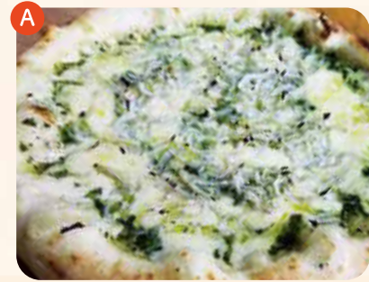
南さつま長命草ピザ ¥1,200

南さつま市で健康維持効果が高いと推奨される野菜のボタンボウフウをジェノバ風ソースにしたピザです!