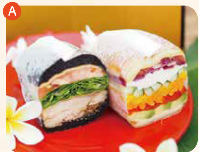
マラサダ (神話の郷) ¥1,000

新鮮で美味しいのは地元の旬の食材!見た目も味も新しいハワイアンサンドイッチ!是非ご賞味下さい。