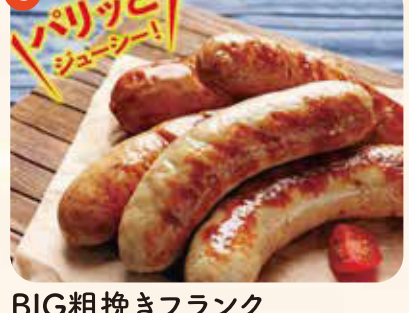
BIG粗挽きフランク (2本) ¥500