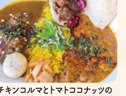
チキンコルマとトマトココナツのあいがけカレー ¥1,000