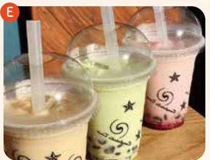
黒糖わらび餅ドリンク choice (黒糖・杏仁・抹茶・ミルクティー・イチゴ) ¥400