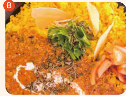
トマトココナツカレー ¥800