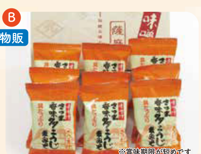
フリーズドライ味噌汁(さつま汁) ¥1,000