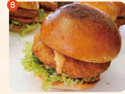
トビウオメンチバーガー ¥600