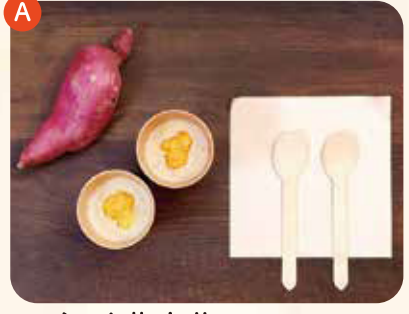
かごんま薩摩芋の温かいポタージュ ¥500

【フレンチシェフが作る】オーガニックの紅はるかを贅沢に使用した温かいポタージュです☆