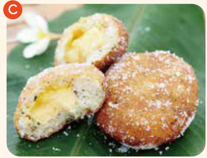
マラサダ (露島レモンティー) ¥300