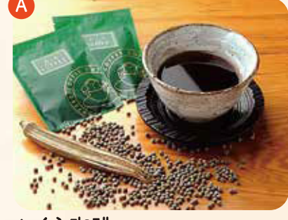
おくら珈琲 choice (ホット・アイス) ¥300

生産日本一のおくらの種を焙煎して、珈琲にしました。日本一のおくらで作ったおくら珈琲めしあがれ!