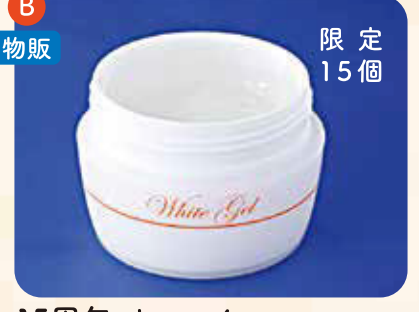
15周年 オールインワンホワイトジェル 限定 15個 ¥1,500