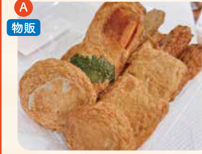
さつまあげ 詰め合わせパック ¥1,000

甘さを抑えて食べやすい薩摩揚げ。きせつの野菜もたくさん入って楽しみながら食べて頂ける逸品です。