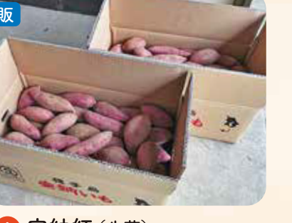
A 安納紅(生芋) 5キロ箱入り ¥2,000