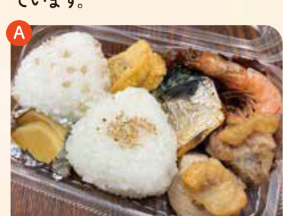
桜島灰干し家弁当 ¥500

おにぎり2種(塩、もち麦)、桜島灰干しのさば炙り焼き・たかえび炙り焼き・唐揚げ、卵焼き、漬物が入っています。