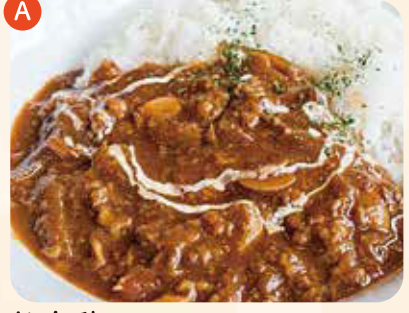
桜島鶏チキンバターカレー ¥600