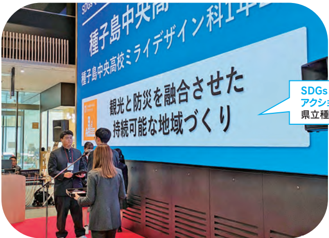
SDGs QUEST アクションアイデア最優秀賞 県立種子島中央高等学校