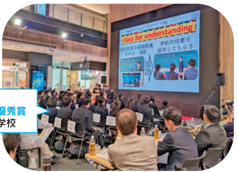
SDGs QUEST アクションアイデア優秀賞 大口明光学園高等学校